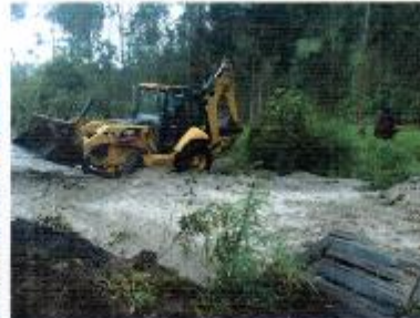
Encauzamiento del río