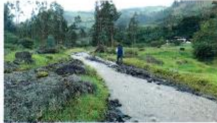
Vía afectada por desborde de Río