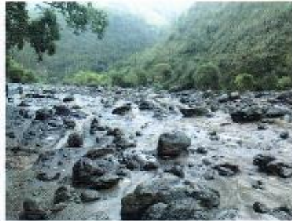
Captaciones de canal de riego loruachana

El Municipio de Patate intervino en esta emergencia con una Cargadora Frontal Case para realizar los trabajos de encause del río Corazón y evitar nuevamente el desborde del mismo hacia la vía de acceso, una volqueta para trasladar el material pétreo para la preparación de una nueva carpeta base a la vía afectada por el desbordamiento mencionado, y una motoniveladora, estos trabajos fueron realizados para recurar el funcionamiento de vía.