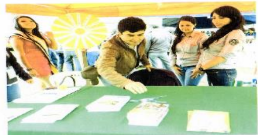
Participación Parroquia Los Andes