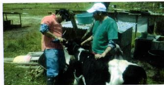
El Sucre 80 animales juzgamiento de ganado