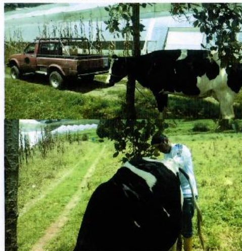
Dirección de Desarrollo Social

Vacunación y desparasitación especies mayores y menores.